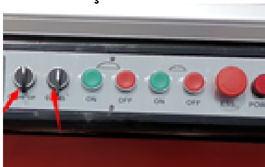
Controlo elétrico de subida/descida e inclinação de serra 0-45°