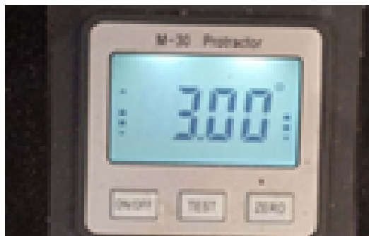
Leitor digital para inclinação serra