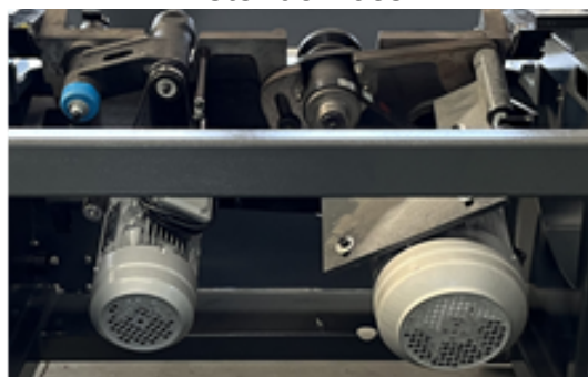
5.5kw motor serra principal + 1.1kw motor de incisor