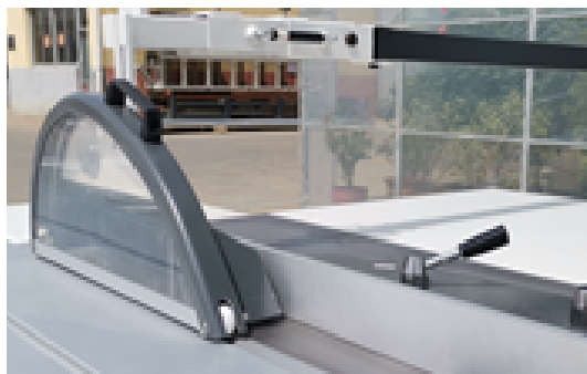
Proteção de poeiras metálica