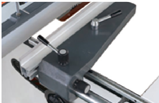
Micro ajustamento, estável e preciso