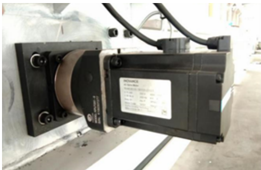
INVT Servo motor