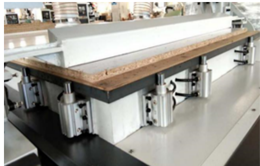
Pop up pins de posicionamento